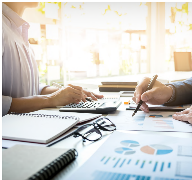
Ассоциации успешно прошли ежегодный аудит.

Аудит деятельности Ассоциаций прошёл успешно, нарушений не выявлено.