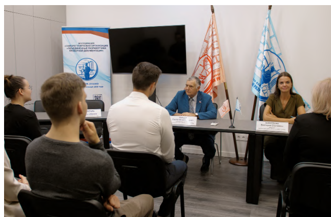
Рабочая встреча членов Ассоциаций.

Традиционно Собраниям предшествовала рабочая встреча представителей членов и подразделений Ассоциаций – в этот раз она состоялась 20 июня. Специалисты СРО ответили на вопросы руководства строительных и проектных предприятий, выслушали и учли предложения относительно проектов решений по вопросам повестки дня.