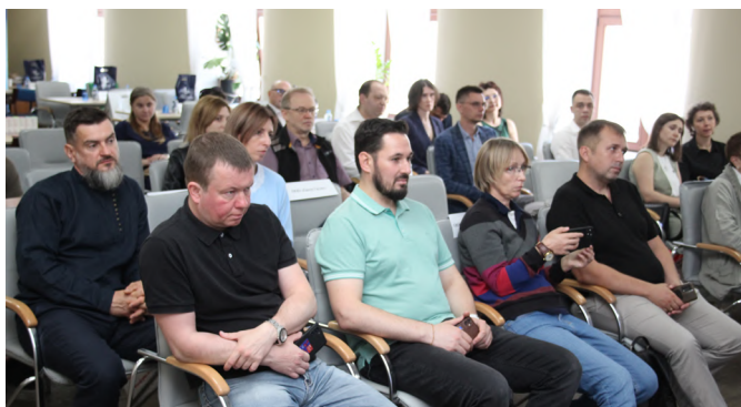
Рабочая встреча с представителями промышленных и строительных компания Калужской области.