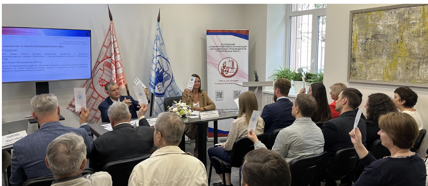
Общее собрание членов Ассоциаций. Идёт голосование.

20 июня состоялись Общие собрания участников Ассоциаций «СРО «ОПСР» и «СРО «ОРПД». О ходе работы расскажет обзорный материал Информационного бюллетеня «СРО».