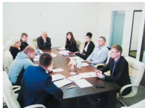
В Барнауле проведен круглый стол, на котором были рассмотрены вопросы повестки дня общих собраний

В конце мая – начале июня 2014 года, уже по сложившейся традиции, руководители и специалисты органов управления и контроля НП «СРО «ОПСР» и «СРО «ОРПД» провели рабочие встречи с представителями предприятий и организаций – членов Партнерств.