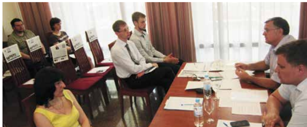
На рабочей встрече в Москве обсуждался персональный состав совета Партнерств

Основным лейтмотивом рабочих встреч, как и в других регионах, стало обсуждение вопросов повестки дня и проектов решений общих собраний. Однако стоит отметить, что в этот раз собравшимся в г. Вологде было предложено также принять участие во 2-м Межрегиональном совещании руководителей членов Партнерств, куда были приглашены руководители предприятий из Москвы, Санкт-Петербурга, Ленинградской и Ярославской областей, а также в совместном открытом заседании членов правлений